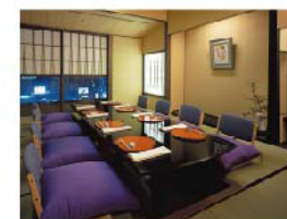
名古屋浅田 お座敷個室

お座敷に椅子をしつらえてのおもてなしもできるようになりました ご予約時にお気軽にお問い合わせくださいませ [30名様まで]